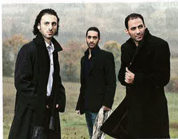
Trio Joubran Le 7 fév., Olympia.