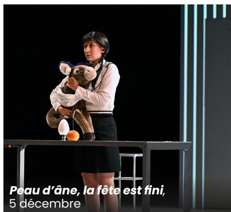
Peau d'âne, la fête est fini, 5 décembre