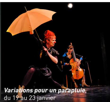
Variations pour un parapluie, du 19 au 23 janvier