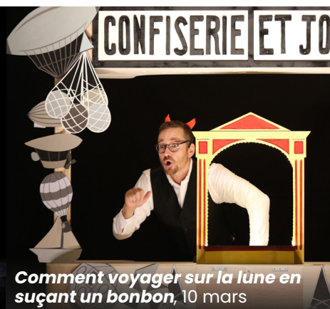
Comment voyager sur la lune en sucant un bonbon, 10 mars